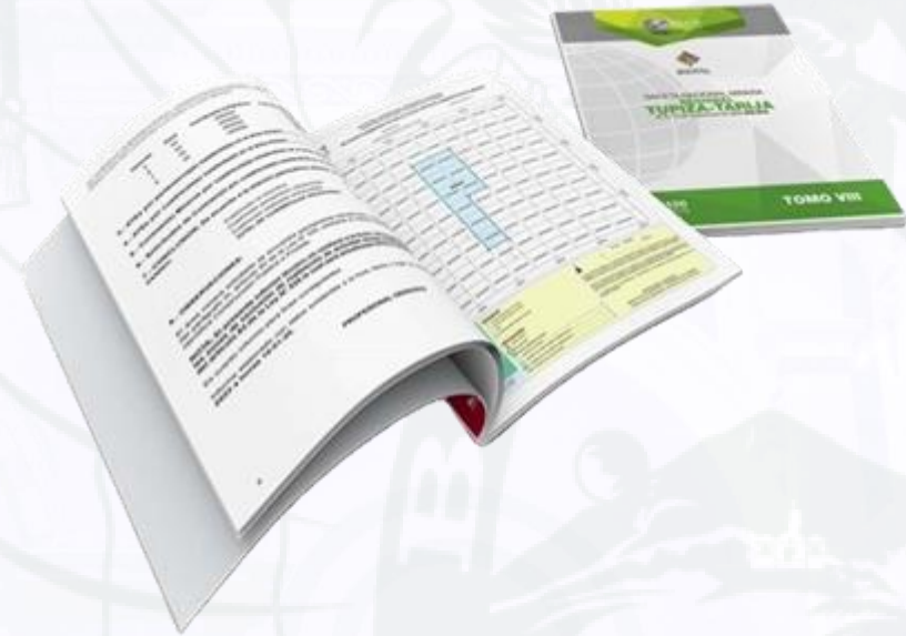
CUADRO COMPARATIVO DE RECAUDACIÓN POR PRESTACIÓN DE SERVICIOS DE CATASTRO (Expresado en Bolivianos)